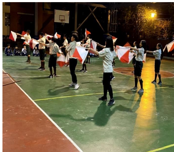
啦啦隊獲邀於烏日米食節演出及童軍晉級考驗營開場雙旗舞表演