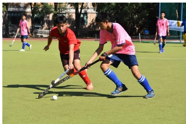
曲棍球隊隊員平日勤於練習，比賽精神英姿颯颯，成績不凡